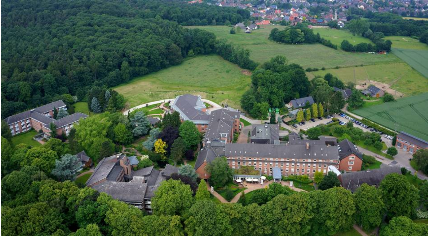
Blick auf das Sankt-Josef-Hospital Xanten aus der Luft.

6. Juli 2022 um 08:44 Uhr | Lesedauer: 4 Minuten